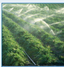
Agricultură (apă răgătit)