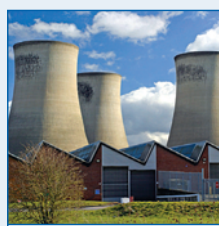
Boilere și cazane